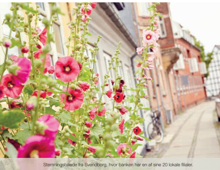
Stemningsbillede fra Svendborg, hvor banken har en af sine 20 lokale filialer.

På datoen for offentliggørelsen af denne halvårsrapport bliver kunderne i Danske Andelskassers Bank betjent via 366 medarbejdere fordelt på bankens 20 fuldtidsåbne filialer, et KundeServicecenter, "Andelskassen Direkte", som betjener bankens fjernkunder, samt fire regionalt placerede erhvervs- og landbrugscentre og en række centralt placerede specialister og supportfunktioner på bankens hovedkontor. Kunderne bliver endvidere serviceret gennem et bredt udvalg af selvbetjeningsløsninger som eksempelvis netbank, mobilbank, pengeautomater og ikke mindst pengeoverførselstjenesten Swipp.